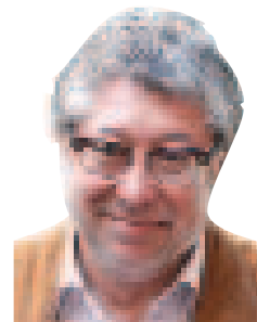
Antonio Balmón Arévalo, l'alcalde

Como cada año, tras la vuelta de vacaciones, nos encontramos con las fiestas del barrio de La Gavarra que con tanto esfuerzo e ilusión organizan las entidades y asociaciones locales con el objetivo de ofrecer un programa de actividades amplio y diverso que nos permita disfrutar de unos días de fiesta con nuestros vecinos y vecinas.