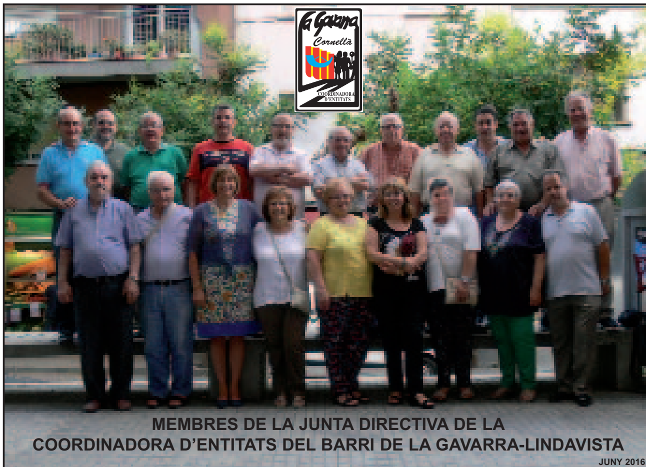
MEMBRES DE LA JUNTA DIRECTIVA DE LA COORDINADORA D'ENTITATS DEL BARRI DE LA GAVARRA-LINDAVISTA

** Els Diables de Cornellà, el Club Natació Cornellà (CNC), la Peña Cultural Recreativa Andalus Los Cabaes, el Centre d'Esplai Infantil i Juvenil Gavina (CEIJ Gavina), el Col·lectiu de Teatre de Cornellà (CTC), l'Associació de Veïns La Gavarra, l'Associació per la Defensa dels Animals de Companyia de Cornellà (ADACC), l'Associació Cultural Amigas de la Moda (ACAM), l'Associació per a la Defensa de la Gent Gran de Cornellà (ADEGGCO), l'Escola de Flamenc Paca García, l'Associació Cultural "El Arte del Flamenco", l'Associació Andalus Hijos de Almáchar i la Peña Malaguista de Cornellà.