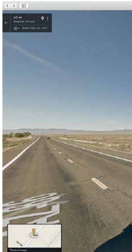
Imatge de coberta: Ruben Torras Llorca