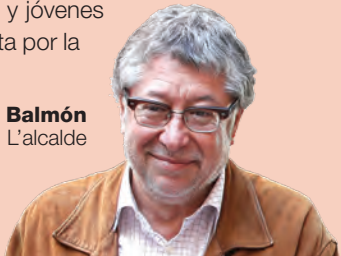
Antonio Balmón L'alcalde

Hoy el flamenco vive un momento dulce, en el que se exploran nuevas experiencias sin perder de vista el arte más puro del flamenco tradicional y el Festival de Arte Flamenco de Catalunya es un referente en el que podemos ver artistas consagrados y jóvenes promesas. Bienvenidos de nuevo a este certamen que apuesta por la calidad en sus propuestas.