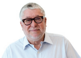
L'alcalde Antonio Balmón