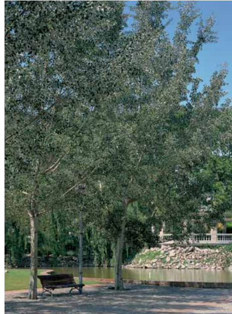
Àlbers prop del llac

Desmés al costat de l'aigua, àlbers en la gran plaça rodona, plàtans i palmeres de Canàries flanquejant el camí de ponent, xiprers, casuarines, robinies i cedres són alguns dels elements més remarcables de la vegetació.