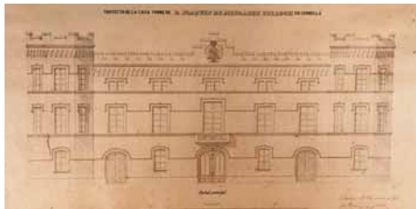
Projecte del palau, 1865.